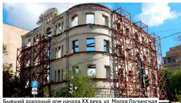
Бывший доходный дом начала XX века, ул. Малая Грузинская

Одним из самых важных снесенных в Москве в 2019 г. зданий «Архнадзор» считает главный дом усадьбы Петрово-Соловово в Тверском районе. Выявленный объект культурного наследия – яркий образец московского деревянного зодчества – построен 200 лет назад. Долгое время заброшенное здание занавешивал фальшфасад. В 2018 г., несмотря на громкие обещания Мосгорнаследия дом отреставрировать, его начали разбирать.