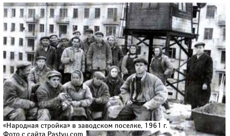
«Народная стройка» в заводском поселке, 1961 г.

ками и цехами. Создание чертежей новых цехов, расчет трудоемкости, планирование участков, составление номенклатуры необходимого оборудования... Работа шла практически круглосуточно.