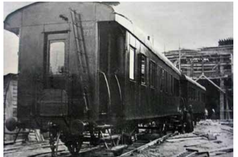
Первый отремонтированный вагон, 1935 г.

Первый год был невероятно тяжелым. Завод не мог сразу свернуть производство вагонов: рабочим надо было зарабатывать на жизнь и кормить семьи. Параллельно прежней работе происходила перестройка. Какие-то цеха и участки годились для будущего производства, какие-то надо было расширять, а некоторые ломать и строить заново. Специалисты, имевшиеся в наличии, тоже проходили отбор: выделяли тех, кто мог участвовать в перестройке завода, брать на себя руководство участ-