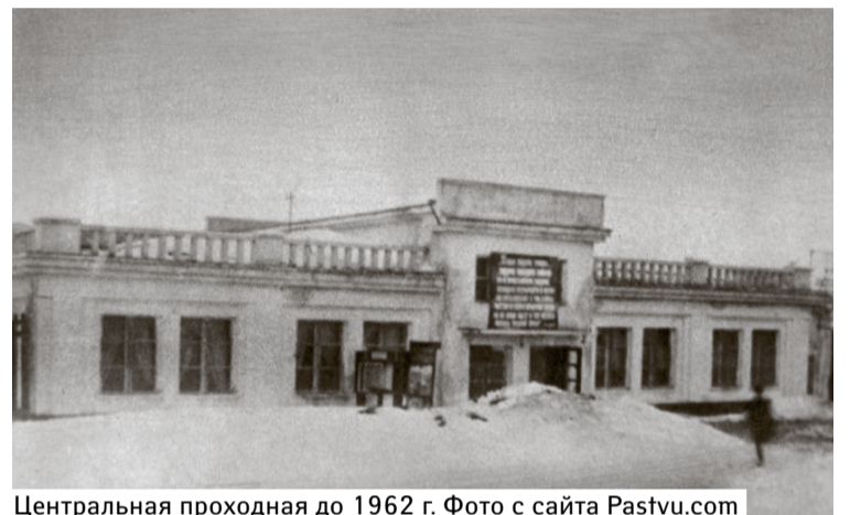
Центральная проходная до 1962 г.