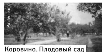
Коровино. Плодовый сад

Поначалу в 1930-х гг. для ВИСХОМа выстроили здание в дру-