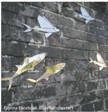
Группа Facebook @skyfishstreetart