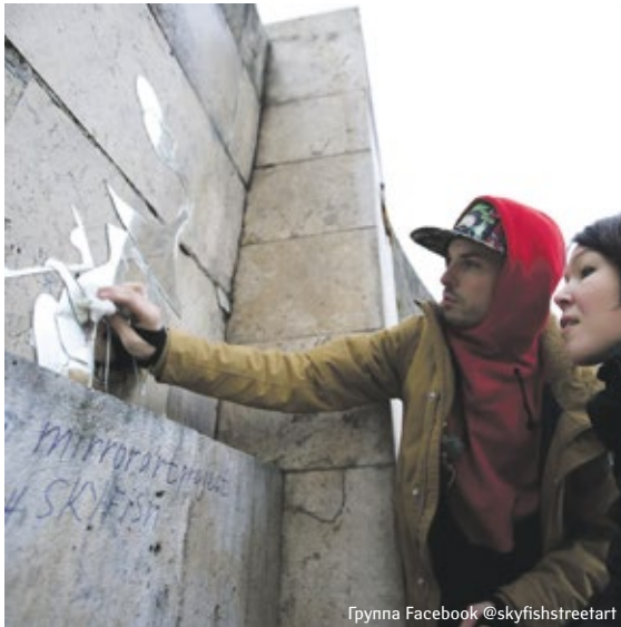
Группа Facebook @skyfishstreetart