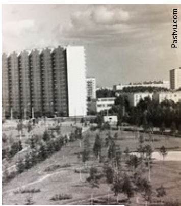
Парк ВИСХОМ, 1982

За время существования института в нем создали около 1200 машин — сеялки, зерновые комбайны,