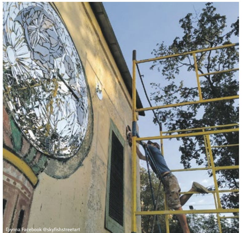
Группа Facebook @skyfishstreetart

В течение трех лет он создавал работы на Верхней Масловке, однако их постоянно уничтожали.