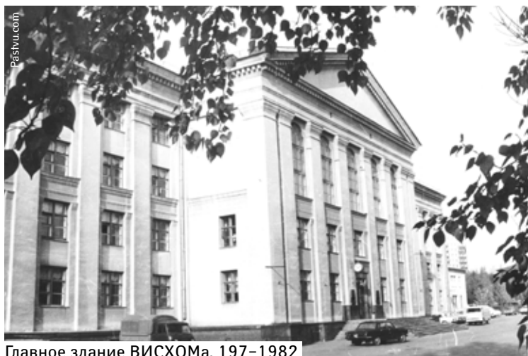
Главное здание ВИСХОМа, 1917–1982

Долгое время Горячкин преподавал в Петровской сельскохозяйственной академии, а после революции стал ее ректором. Он основал новую научно-техническую дисциплину под названием «Земледельческая механика». Именно ему принадлежала сама идея создания ВИСХОМа, и лучшего руководителя для института представить было нельзя. Особенно основательной и надежной его кандидатура была на фоне общей массы неважно обученных и неопытных «красных директоров», которым чуть ли не каждый месяц давали новое назначение: