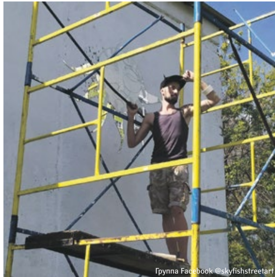
Группа Facebook @skyfishstreetart